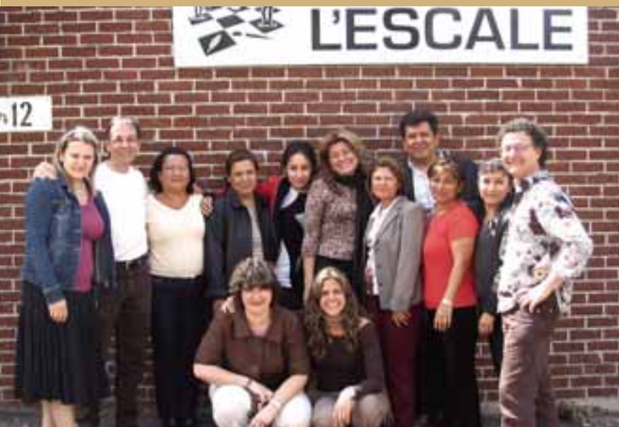
La délégation salvadorienne avec des intervenants du CSSSAM-N, de la Santé Publique de Montréal et de la Maison des jeunes Escale 13-17

Malgré la distance qui sépare le Québec du El Salvador, on s'aperçoit que les enjeux sont relativement semblables.