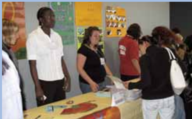
Préparation des kiosques d'information par les intervenants et les partenaires du CSSSAM-N