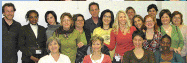
Les équipes Jeunes en difficulté des CLSC d'Ahuntsic et Montréal-Nord

Il ne faut pas négliger que le succès de cette soirée est grandement attribuable à la collaboration des équipes du programme Jeunes en difficulté et d'autres collègues. Nous saluons également la présence très appréciée de nos partenaires tels Pause-Famille , RePère , Autour du bébé , Carrefour Jeunesse Emploi Bourassa-Sauvé , Entre Parents , Fondation de la visite , 1,2,3 Go , Un itinéraire pour tous , Coup de pouce jeunesse , Québec en forme , etc.