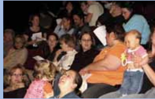
Une salle bien achalandée !