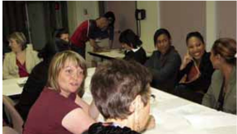
Une présence importante !

ATTENTION ! Cet automne auront lieu des élections, car il reste à pourvoir un poste concernant la mission Hébergement au sein du CECII. Surveillez les communiqués à venir. Nous comptons sur vous.