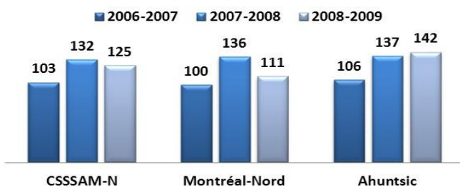
Nombre d'heures de soins requises évaluées avant l'admission de l'usager de 75 ans et plus selon le territoire et la période, 2006-2007 à 2008-2009