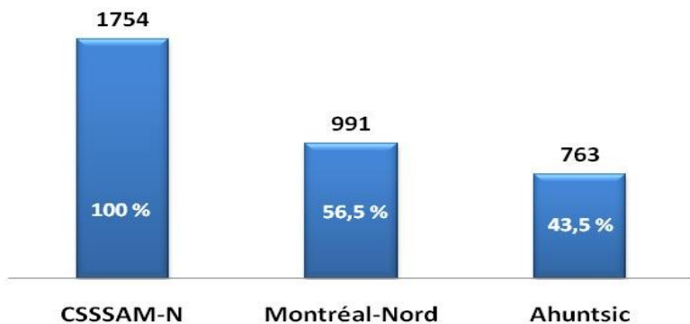
Proportion (%) et nombre d'enfants de moins de 1 an utilisateurs de services de santé selon les CSSS de Montréal, 2005-2006